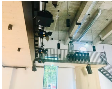
Zu den Highlights zählt eine optimal abgestimmte Audioanlage von Alpsaudio sowie eine Mediensteuerung von Kramer, die per Touchdisplay die komplette Saaltechnik bedienbar macht.