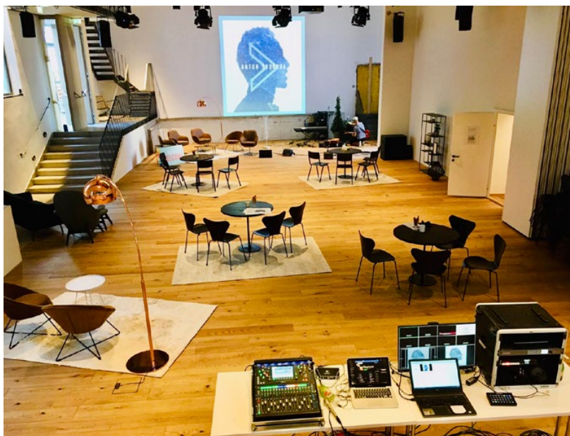
Der Kapitelsaal in Salzburg ist eine beliebte Event-Location der Erzdiözese, die nun durch modernste AV-Technik für Präsentveranstaltungen ebenso gerüstet ist wie für Live-Streaming.

Noch im Sommer, dh vor dem Wiederaufflammen der Covid-Pandemie und den damit einhergehenden Einschränkungen, wurde der Kapitelsaal für Live-Events, Besprechungen, Seminare uÄ genutzt. Die Eröffnung erfolgte im Rahmen einer CD-Präsentation, bei der die neu installierte Technik sogleich ihre Vorzüge unter Beweis stellen konnte. Für die fachgerechte Realisierung des Projekts hatten die ortsansässigen Spezialisten von KEY-WI MUSIC gesorgt und dabei auch die besondere Eigenheit – und zugleich große Herausforderung – des Kapitelsaals bravourös gemeistert: Der Saal ist dreigeteilt und kann je nach Bedarf entweder als eine große Einheit oder aufgesplittet auf drei kleinere Einheiten verwendet werden. Unabhängig von der Art der