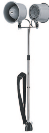
als Trägergarnitur (FüÙe abgeschraubt)