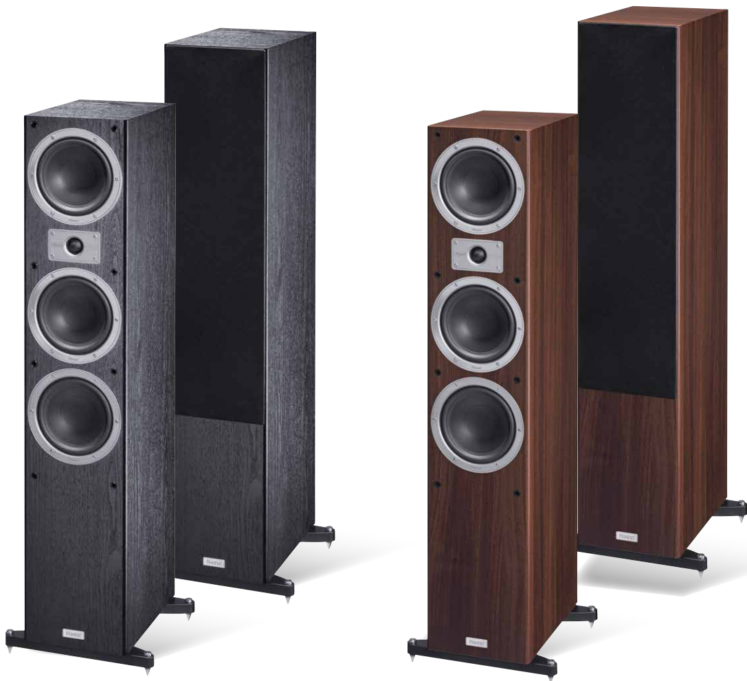
Esche Dekor Schwarz