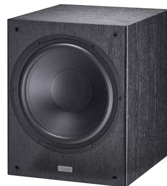
Tempus Sub 300A