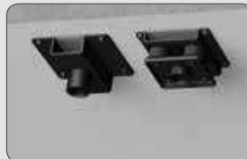
Beton CMA330 & CMA345