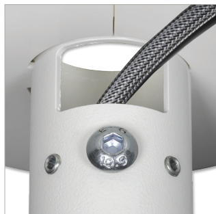
Integrierte Kabelführung durch die Oberseite oder Seite der Deckenhalterung