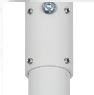
Madenschrauben ermöglichen eine Feinjustage des Rohrs, um eine perfekt gewinkelte Installation zu gewährleisten