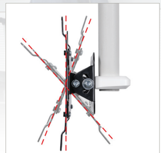
Einfache Neigungsverstellung des Bildschirms