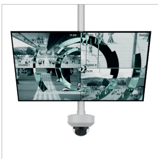
Befestigt eine Dome-Kamera und einen mittelgroßen Flachbildschirm an der Decke