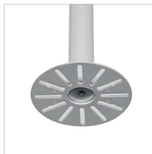
Mehrere Montagepunkte für Kameras mit Befestigungspunkten im Abstand von bis zu 127.5mm