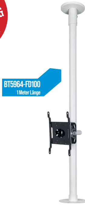
BT5964-FD100 1 Meter Länge