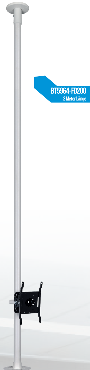
BT5964-FD200 2 Meter Länge