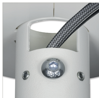
Integrierte Kabelführung durch die Oberseite oder Seite der Deckenhalterung